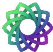
VERSATILE USE VŠESTRANNÉ POUŽITIE